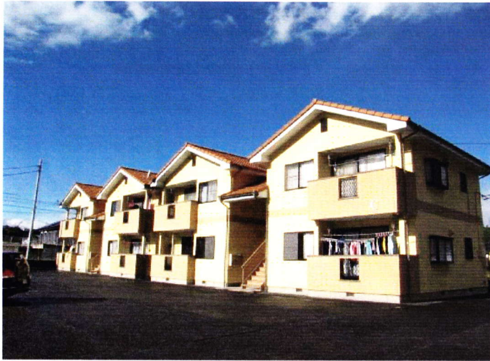
四季を感じる穏やかなレジデンス